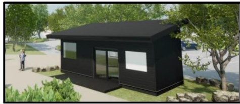
サービスセンター