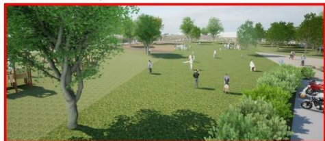
藤の広場(芝生広場)