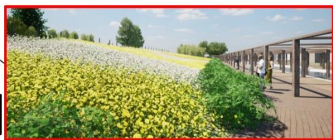
ガザニアの植栽(一部令和5年10月頃WSで植栽予定)