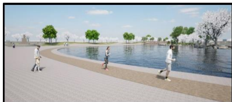
ジョギングコース