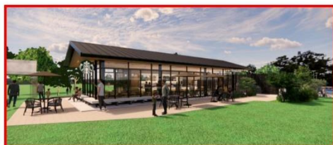
スターバックスコーヒー