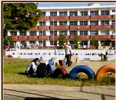
10月北小学校の除草作業