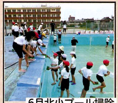
6月北小プール掃除