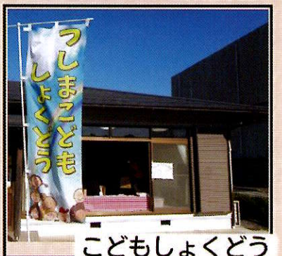
こどもしょうどう