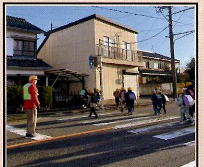
小学校登下校見守り隊