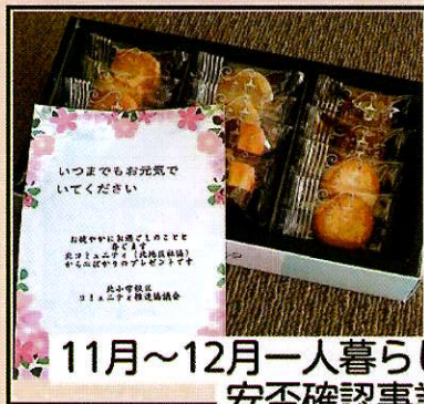
11月～12月一人暮らし 安否確認事業