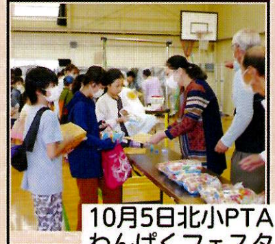
10月5日北小PTA わんぱくフェスタ