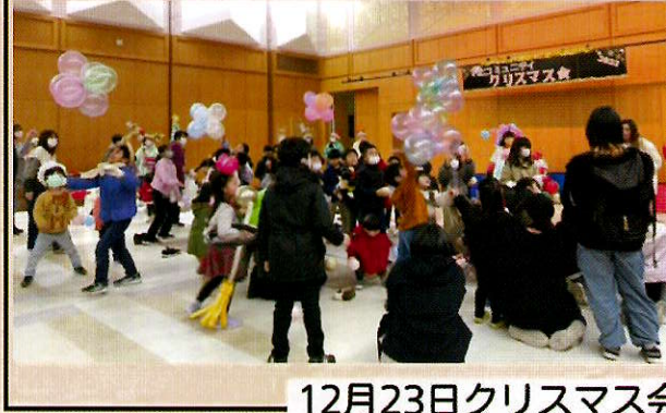
12月23日クリスマス会