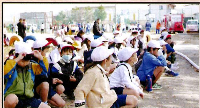
11月11日北小学校区防災訓練