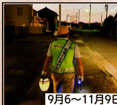
9月6～11月9日 たすきりレー