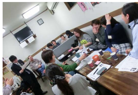
→最後に全員で共有しました！