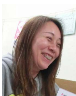
みんなでドレミの歌