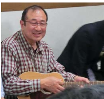
ギター演奏「われもこう」