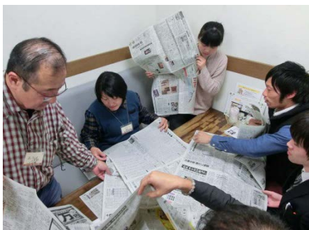
まずはチーム対抗「新聞配達」ゲーム

「ごえんですよ」チームは、「みんなでばんざいおばんざい！ごえんかい」に向けた最終打ち合わせを、「遊び隊」チームは3/17「ボードゲームで遊ぼう！」をやってみた手応えや課題などについて話し合いました。