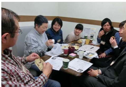
→ あっちゃん差し入れの焼き芋を食べながら話し合い