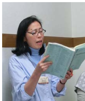
メンデルスゾーンなど独唱