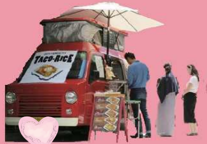
※写真は全てイメージです