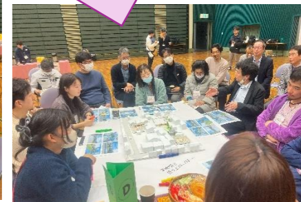
旧いちい信用金庫のテーブル

天王通りからパティオの見え方を工夫して欲しい、でも奥まった空間だからこそゆったりできる場所になったらいいな！ 人が集まりたくなるインスタ映えスポットがあったらいいかも、例えばつしま丸くん！