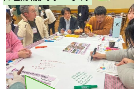
津島駅前のテーブル

電車を使わない人も利用できにぎわった駅にしたい！ 簡易的でもいいから泊まれる場所が欲しい！ チャレンジショップができる場所があるといいな！