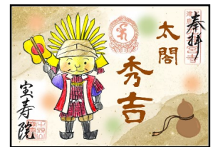
▲宝寿院の絵付御朱印