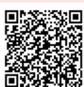
下水道接続 促進補助金