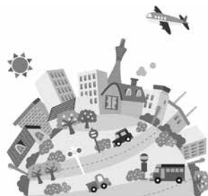
街並みが清潔になります