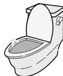
トイレが水洗化できます