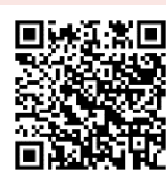
下水道接続 補助金適用区域