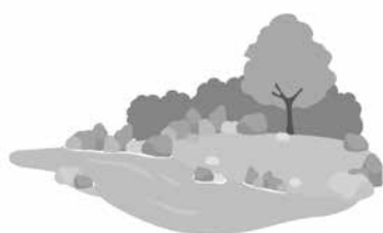
川や海がきれいになります